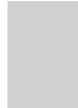
205 x 264 mm