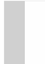
1/2 Hauteur P.P