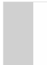
1/3 Hauteur P.P