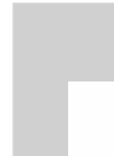
1/4 Page P.P