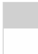
1/2 Largeur P.P